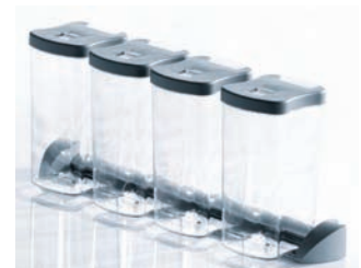
C Ensemble de contenants à épices