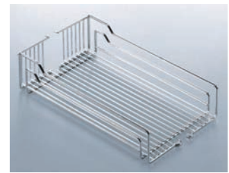
A Panier en fil