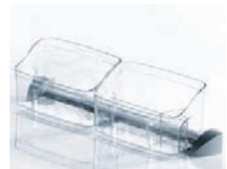
D Ensemble de contenants multi usages